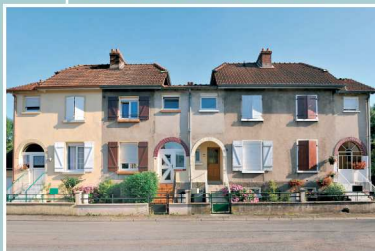
Modèle n°2 : maisons jumelées dont les entrées sont soulignées par des arcades en brique

Les entrées dans la cité sont soulignées par la qualité architecturale, la volumétrie ou l'orientation des bâtiments.