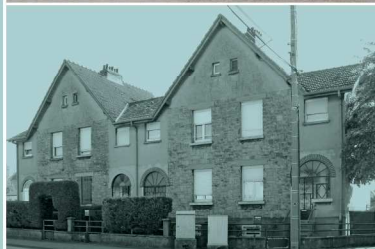
Modèle n°3 : maisons jumelées avec pignons sur rue, parement en pierre calcaire et décor d'arcades en brique

À l'origine, la cité constitue un quartier indépendant de Terville bénéficiant de structures propres, gérées par l'usine.