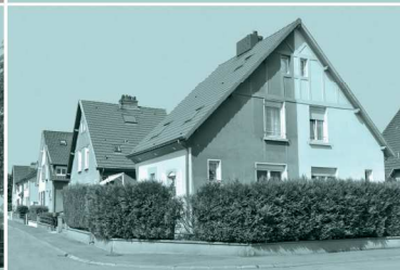
Modèle n°4 : maisons jumelées avec pignon sur rue à décor de faux pans de bois en ciment moulé (parfois disparus)

Malgré les remaniements architecturaux, conséquence de l'accession à la propriété des occupants dès 1988, la cité garde une certaine unité.