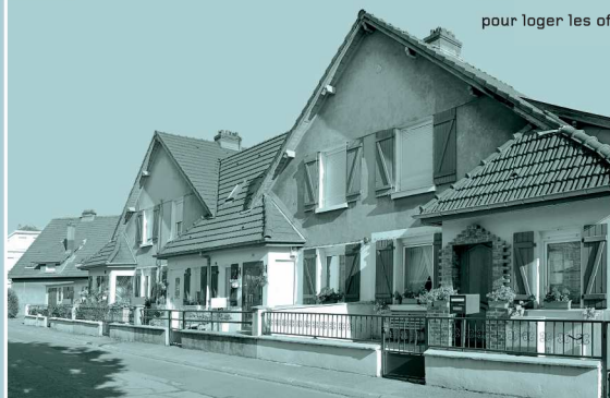
Modèle n°1 : maison jumelées avec entrées en arcades

Conséquence de la crise économique, la mise en service de l'usine prend du retard et quelques bâtiments sont provisoirement utilisés pour loger les officiers de la Ligne Maginot.