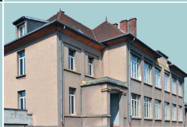
École du Moulin, construite dans les années 1930, à proximité de la cité